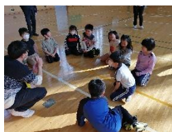
↑ 体育館では体を動かして楽しく遊びました。